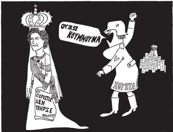
Του ΔΗΜΟΥ ΣΚΟΥΛΑΚΗ

Μετά τήν έπιτυχή λήξη τής άπεργίας, άρχισαν άμέσως νά παρατηρούνται έντονες ζυμώσεις για τήν διεξαγωγή άγώνα ένάντια σε άπόφαση τού Άρειου Πάγου, που έπιχειρεί νά «νομιμοποιήσει» τελικά τήν δικτατορική και όχι έπτάωρη εργασία για τούς οικοδόμους.