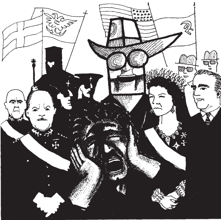
Σκίτσο της ΣΤΕΛΛΑΣ