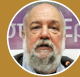
Νίκος Θεοχαράκης Οικονομολόγος, Καθηγητής ΝΟΠΕ