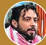
Ραμσίς Κιλανί Σοσιαλισμός από τα Κάτω, Γερμανία