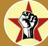
Γκαϊάθ Ναϊσέ Επαναστατικό Αριστερό Ρεύμα, Συρία