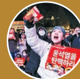
Ιλ Μουνγκ Τσού Εργατική Αλληλεγγύη, Ν. Κορέα