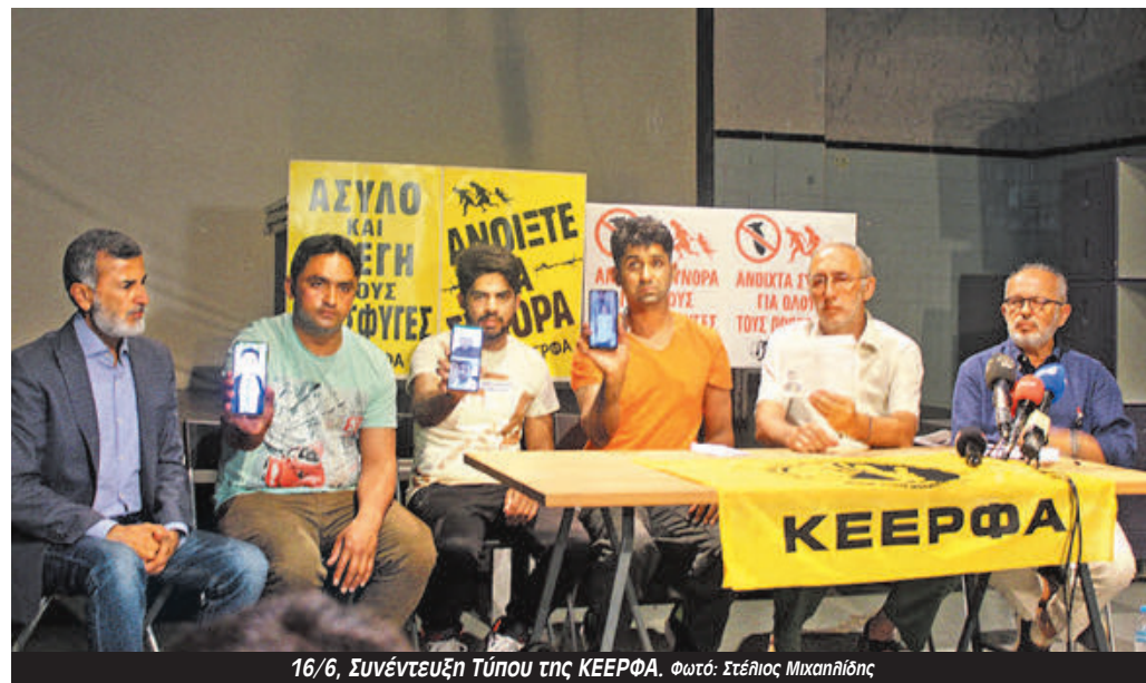
16/6, Συνέντευξη Τύπου της ΚΕΕΡΦΑ.

Είμαστε όλοι συγκλονισμένοι που προκάλεσε αυτό το ναυάγιο πρώτα απ' όλα στις οικογένειες των αγνοουμένων και των επιβεβαιωμένων νεκρών. Έχουμε ζήσει πρόσφατα στην Ελλάδα ένα έγκλημα με 57 νεκρούς στα Τέμπη. Συγκλονίστηκε όλη η χώρα. Δυσόμοι εκατομμύρια άνθρωποι βγήκαν στο δρόμο για να διαμαρτυρηθούν γιατί όλος ο κόσμος το απέδωσε ως έγκλημα των ιδιωτικοποιήσεων.