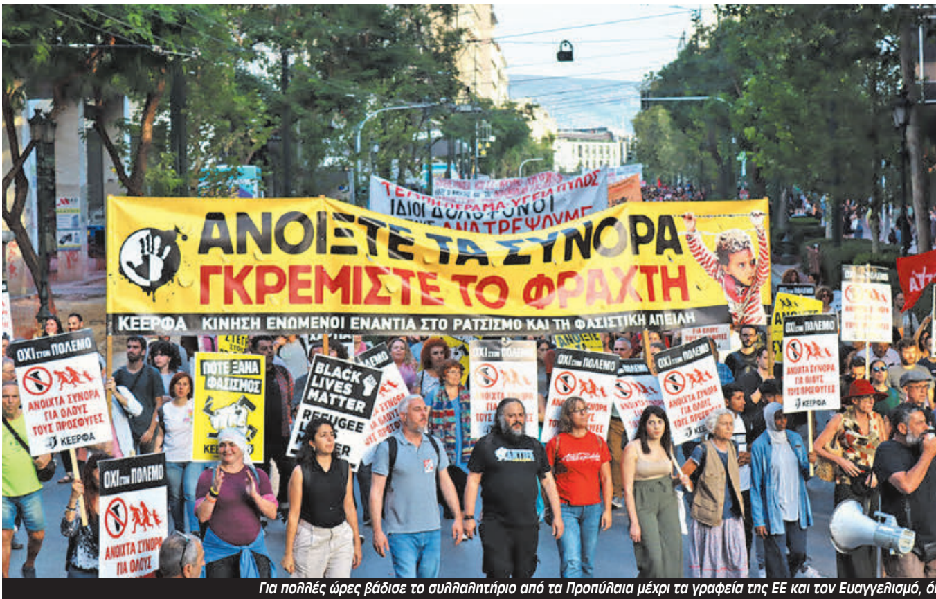
Για πολλές ώρες βάδισε το συλλαλητήριο από τα Προπύλαια μέχρι τα γραφεία της ΕΕ και τον Ευαγγελισμό, όπου τερμάτισε αφού ενώθηκε και ο κόσμος από το Σύνταγμα.