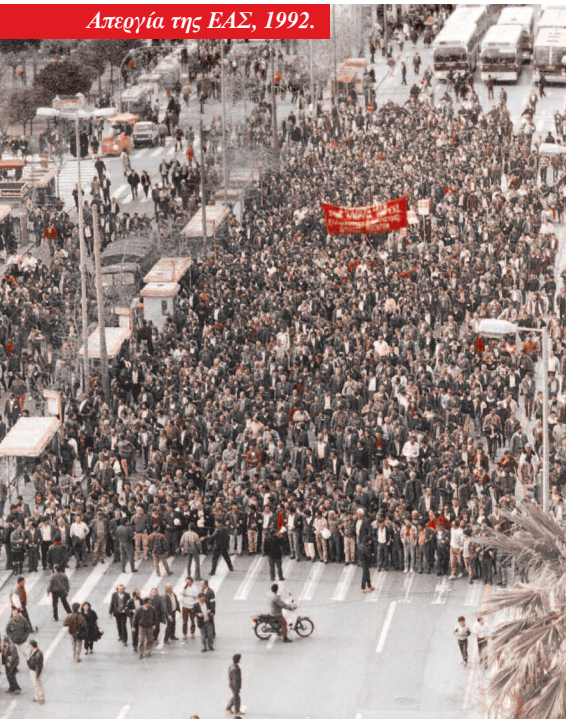
Απεργία της ΕΑΣ, 1992.

Για επικοινωνία: • socialismosapotakato@gmail.com • τηλ. 210 5247140